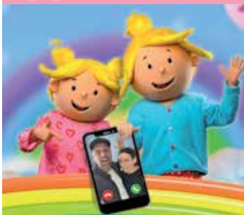
De Zoete Zusjes lossen het op! 3+ zo 17 mei

www.spant.org Dr. A. Kuyperlaan 3 | 1402 SB Bussum