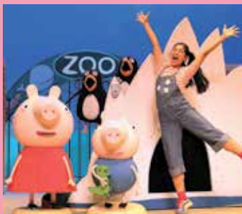
Peppa Pig Live! 2+ za 30 mei